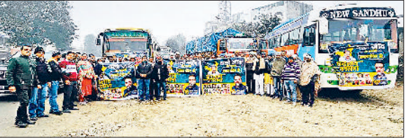
यमुनानगर से जींद जनसभा के लिए रवाना होते आप कार्यकर्ता।