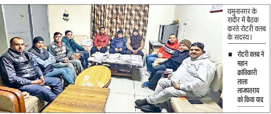
यमुनानगर के रादौर में बैठक करते रोटरी क्लब के सदस्य।