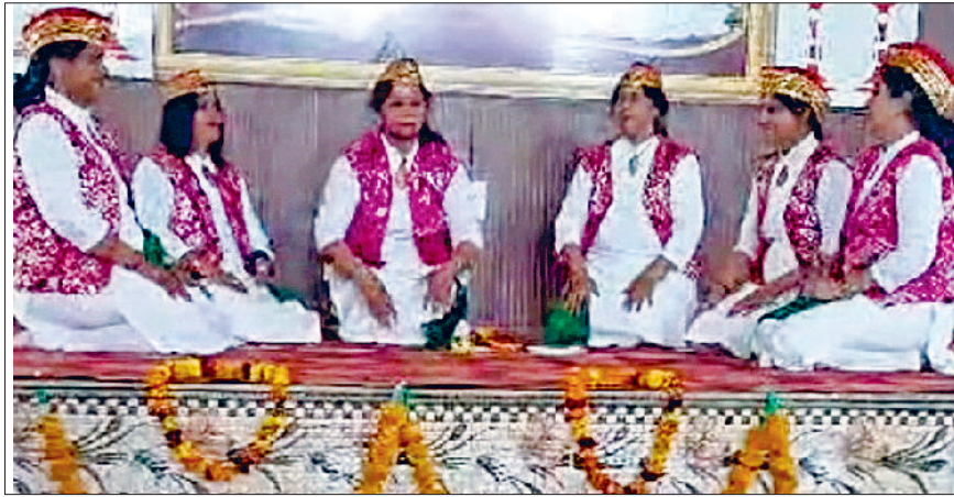
योग कव्वाली प्रस्तुत करते हुए युधिष्ठिर जिला की साधिकाएं।