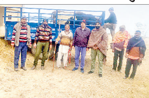
गांव में घूमने वाले पशुओं को पकड़कर नदीशाला ले जाते ग्रामीण।

किसानों की मानें तो पशुओं ने उनकी फसलों को तबाह करके रख दिया है। कड़कड़ाती सर्द रातों में किसानों को अपनी फसलों को पशुओं से बचाने के लिए पहरेदारी करना पड़ रही है। पशु बाजारों में घुसकर दुकानदारों को परेशान करते हैं। बीच सड़क पर बैठकर रास्ते को पूरी तरह से अवरुद्ध कर देते हैं। कई पशु तो लोगों को टक्कर मारकर मौत के घाट उतार चुके हैं। इनकी वजह