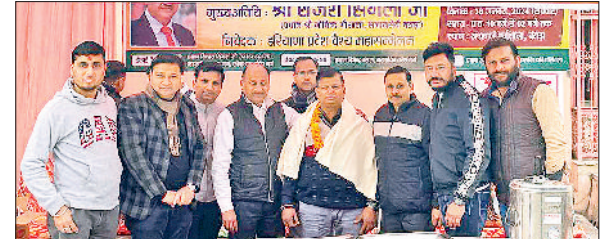
बराड़ा। जयंती समारोह में भाग लेते पदाधिकारी एवं सदस्य