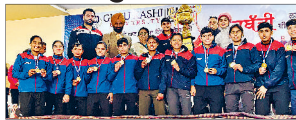
कुरुक्षेत्र। महिला कबड्डी की विजेता टीम।

कुरुक्षेत्र विवि की महिला कबड्डी टीम गुरु काशी यूनिवर्सिटी तलवंडी साबो में आयोजित नॉर्थ जोन इंटर यूनिवर्सिटी कबड्डी महिला चैंपियनशिप 2023-24 की विजेता बनी। 25 से 27 जनवरी के बीच आयोजित प्रतियोगिता में केयू महिला कबड्डी टीम ने इतिहास रचते हुए नॉर्थ जोन इंटर यूनिवर्सिटी महिला कबड्डी प्रतियोगिता की ट्राफी अपने नाम की। इस अवसर पर