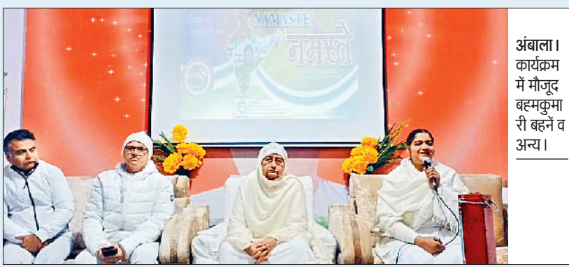
अंबाला। कार्यक्रम में मौजूद ब्रह्मकुमारी बहनें व अन्य।