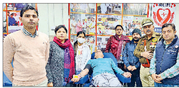
कुरुक्षेत्र। शिविर में रक्तदान करते रक्तदाता।