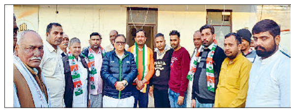
कुरुक्षेत्र। कांग्रेस में शामिल हुए कार्यकर्ता।