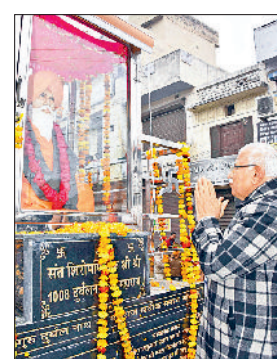
मुख्यमंत्री मनोहर लाल करनाल के बांसो गेट स्थित चौक पर संत शिरोमणि श्री श्री 1008 श्री दुर्बलनाथ महाराज की मूर्ति का अनावरण करते व समारोह को संबोधित करते हुए।

मुख्यमंत्री मनोहर लाल ने आज करनाल के बांसो गेट स्थित चौक पर संत शिरोमणि श्री श्री 1008 श्री दुर्बलनाथ महाराज की मूर्ति का अनावरण किया और समाज के लोगों को शुभकामनाएं व बधाई दी। इस मौके पर मुख्यमंत्री ने कार्यक्रम का उ प स्थित जनसमूह को संबोधित करते हुए कहा कि हम सब संतों की बात का अनुसरण करके अपने जीवन में बड़ा बदलाव ला सकते हैं और एक अच्छा ईंसान बन सकते हैं। उन्होंने कहा कि समाज में वर्षों से ही संत महापुरुषों का अपना श्रेष्ठ स्थान संतो महापुरुषों द्वारा हमेशा समाज को नई दिशा दिखाने का कार्य किया