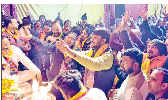
कुरुक्षेत्र। श्रीखाट्टश्याम संकीर्तन की आरती करते श्यामप्रेमी।