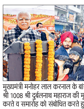
मुख्यमंत्री मनोहर लाल करनाल के बांसो गेट स्थित चौक पर संत शिरोमणि श्री श्री 1008 श्री दुर्बलनाथ महाराज की मूर्ति का अनावरण करते व समारोह को संबोधित करते हुए।

गया है, इन्होंने संतों में संत शिरोमणि श्री दुर्बलनाथ महाराज का नाम भी शामिल है। मुख्यमंत्री ने कहा कि संत महापुरुष अच्छे रास्ते पर चलने की प्रेरणा प्राचीन काल से ही आमजन को देते आ रहे हैं। असहाय की सहायता करना, महिलाओं की रक्षा करना, ऐसी शिक्षा संत महापुरुष देते आ रहे हैं। उन्होंने आमजन से भी अह्वान किया कि हम सबको नस्वार्थ भावना से बिना फल की इच्छा करते हुए कर्म करते रहना चाहिए, यही पवत्रि गीता का संदेश है। उन्होंने कहा कि वर्तमान समय में कुछ लोग जीवन का रास्ता भटक कर स्वार्थ भावना से अभिभूत हो जाते हैं, जिस कारण उनका जीवन कठिन हो जाता है। संत महापुरुषों का रास्ता चुनकर ही हम अपने जीवन को सुलभ बना सकते हैं। मुख्यमंत्री ने कहा कि प्रदेश सरकार ने सभी समाजों व सभी धर्मों के संत महापुरुषों को सम्मान देने के लिए संत महापुरुष विचार सम्मान एवं प्रचार-प्रसार योजना शुरू की है। इस योजना के माध्यम से ही प्रदेश सरकार सभी संत महापुरुषों की जयंतियां प्रदेश स्तर पर मना रही है।