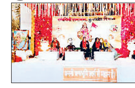
संविधनी समामम में भाग लेती महिलाएं।

भारत के विकास में महिलाओं की भूमिका, उनकी स्थानीय समस्या, स्थिति एवं समाधान को लेकर करनाल के सेक्टर 14 स्थित कृष्णा मंदिर में सशक्तिकरण सम्मेलन का आयोजन किया गया जिसमें करनाल, कुरुक्षेत्र और कैथल जिले की करीब 2 हजार महिलाओं ने भागीदारी की।