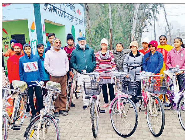
अंबाला। बच्चों को साइकिलें देते पूर्व मंत्री विनोद शर्मा व मौजूद ग्रामीण।

वर्तमान में युवा विदेश जाने की तरफ अग्रसर