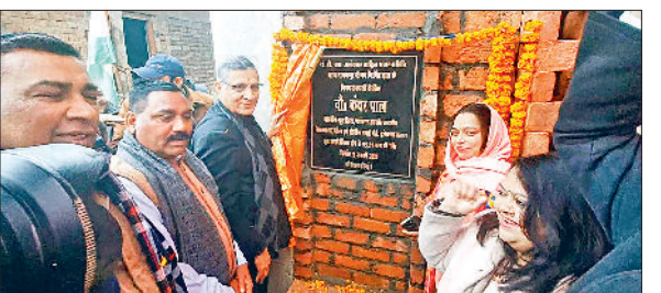
यमुनानगर के गांव मानकपुर में विकास कार्यों का शिलान्यास करते स्कूल शिक्षा मंत्री कंवरपाल।

डॉ.बीआर अंबेडकर साहित्य प्रचार समिति द्वारा मानकपुर में अभिनंदन समारोह का आयोजन किया गया। इस दौरान हरियाणा के स्कूल शिक्षा मंत्री कंवरपाल बतौर मुख्य अतिथि शामिल हुए। मौके पर समिति द्वारा